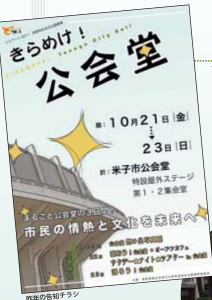
昨年の告知チラシ