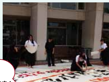
米子西高 書道部による書道パフォーマンス。 公会堂の前庭が盛り上がりました！