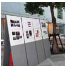
米子市文化ホールでの展示風景

建設中の公会堂など、貴重な写真を公開しています。 見かけたら、ぜひのぞいてみてください！